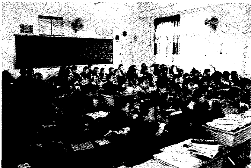
南门镇中心小学学生正在喝牛奶。