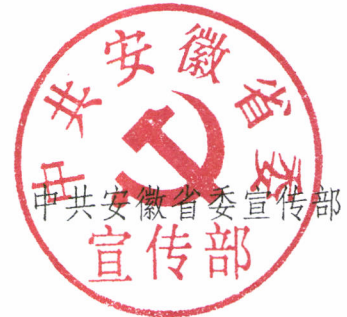
中共安徽省委宣传部